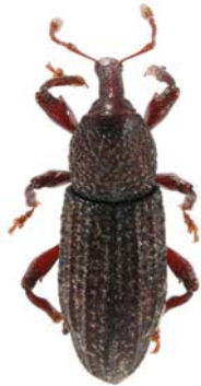
Iberoplathus imbricatus (Curculionidae)