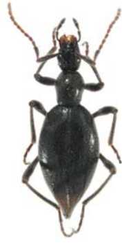
Palaeostigus prolongatus (Scydmaenidae)

Conformément au programme, les sorties ont eu lieu le samedi au Pic d'Orhy et au bois de Saint Joseph, le dimanche en forêt d'Iraty et le lundi en forêts d'Issaux et de Sare (la